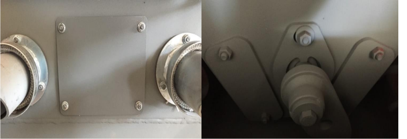
řekil 5 : Pel- 20/130 Serisi Kazanlar Temizleme Kapađı