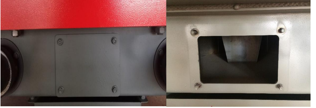
řekil 4 : Pel-150/1000 serisi kazanlar temizleme kapađı

Ocak ii temizliđi, yakıtın katılaşıp ocak iinde tutunmasını nlemek iin iki ayda bir yapılması gerekir. Ocak iindeki pelet/kmr bořaltılıp dip kısımda katılařan yakıt temizlenmelidir. Ayrıca ocak ii hava kanalının ideal řekilde fonksiyonlarını yerine getirebilmesi iin, iki kl ıkartma helezonu ortasında bulunan sa kapađı skn ve ocak iini bir gelberi yardımı ile sezon sonu bir kez mutlaka temizleyin. Dkm ocak zerindeki hava deliklerini herhangi bir ivi veya tel yardımı ile iki ay da bir temizleyin. Bakınız (řekil 4) Pel/Koz-H-100 ve Pel/Koz-H-1000 arası modellerin, (řekil 5) PEL/KOZ-60 modelin fotođraflarıdır.