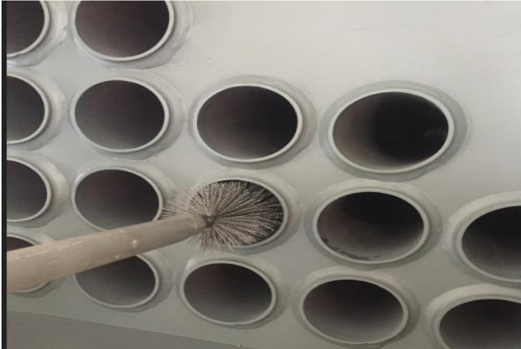
Şekil 3 : Kazan Duman Boruları Temizliği