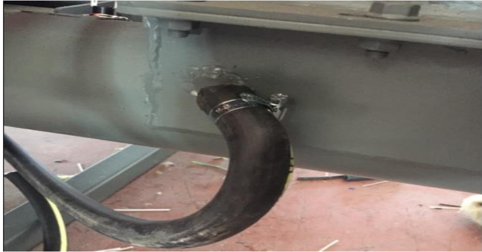
Şekil 6: Yakıt Yükleme Borusu Bypass Hortumu

Bypass hortumu döküm ocakta peletin yanması esnasında oluşan dumanın yakıt yükleme borusunun içinden geçerek yakıt haznesine ulaşmasını engellemek amacı konulmuştur. Bypass hortumu fandan alınan bir miktar havayı yakıt yükleme borusuna ulaştırır. Hortumun yakıt yükleme borusuna takıldığı noktada pelet ve pelet tozundan kaynaklı tıkanma oluşursa, hortumdan yakıt yükleme borusuna hava akışı kesilir ve böylece yakıt haznesine duman gelmeye başlar. Bu gibi bir durumla karşılaşırsanız hortumu boruya takıldığı yerden çıkartın ve borunun içini tel veya benzeri bir alet ile temizleyin. Hazneye duman gelmesinin başlıca sebebi bu tıkanma olabilir. Bunun yanı sıra bacanın çekmemesi veya duman borularının temizlenmemiş olması da hazneden duman gelmesine sebep olabilir. Aşağıda şekil 6 da hortum ve boru bağlantısı fotoğrafı bulunmaktadır.