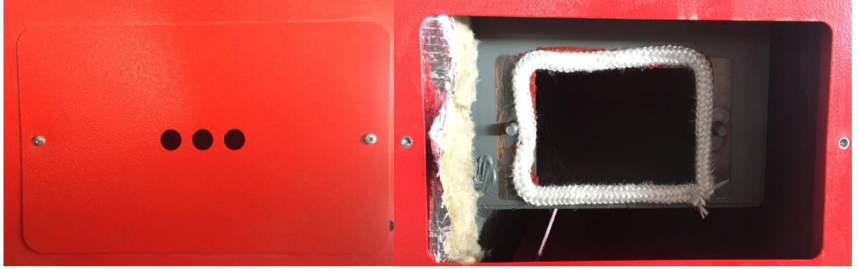
Kapak ( 1 )

problemi yaratır. Davlumbaz temizleme kapağı kazanın yan arka kısım, sağ ve sol iki tarafta da bulunur. Bu kapak sökülüp ( Kapak 1 ) iç kısımda bulunan kelebek somunlu ( Kapak 2 ) diğer kapağa ulaşılır. Temizliği buradan yapabilirsiniz.